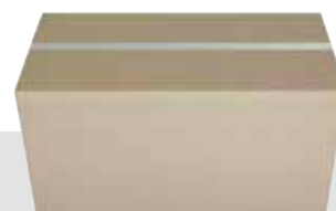
ca. 84x43x43 cm